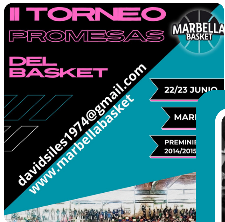
II TORNEO PROMESAS DEL BASKET