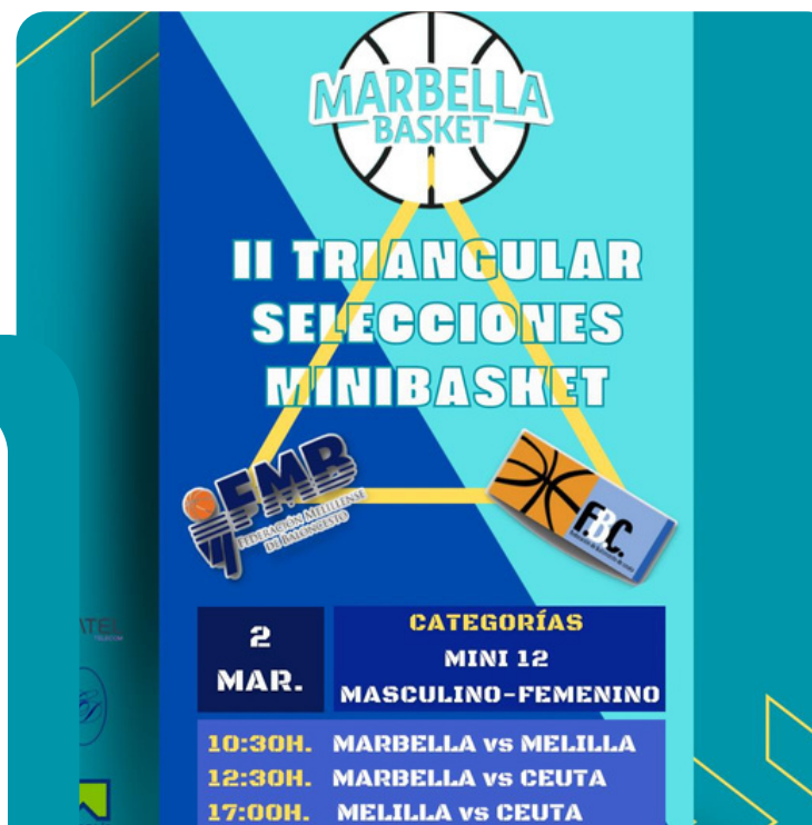
II TRIANGULAR DE SELECCIONES MINIBASKET

El club organiza diferentes Clinics, Torneos y Campus a lo largo de la temporada y puede llevar el nombre de "TU MARCA"